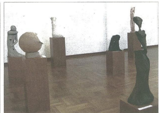
Umelkyňa k tvorbe priviedla stratu zraku.