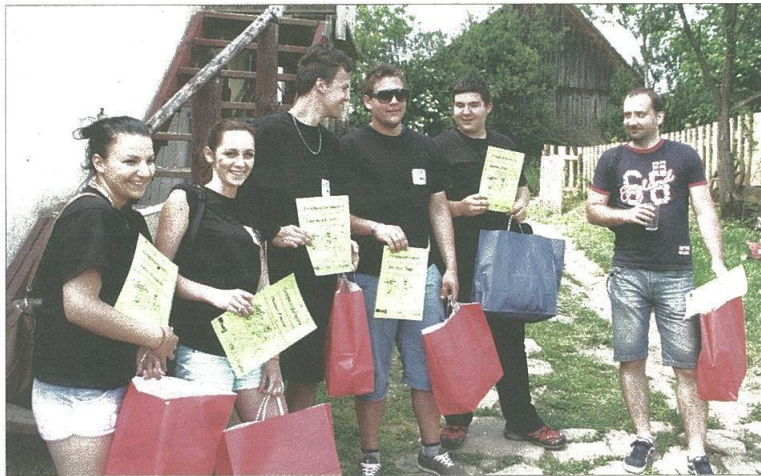
Študenti s pedagógi SOŠ Majstra Pavla v Levoči s diplomami farmára.

Celé podujatie, ktorého sa mohla zúčastniť i široká verejnosť, sa nieslo v snahe ponúknuť mladým ľuďom bližšie spojenie s prírodou a s činnosťami, ktoré slúžia k zabezpečeniu si základných potrieb na živobytie. Do spoločnej aktivity sa zapojilo šesť škôl mesta Levoča. Disciplíny, ktoré museli študenti zvládnuť, preverili ich schopnosti a zručnosti. Mno-